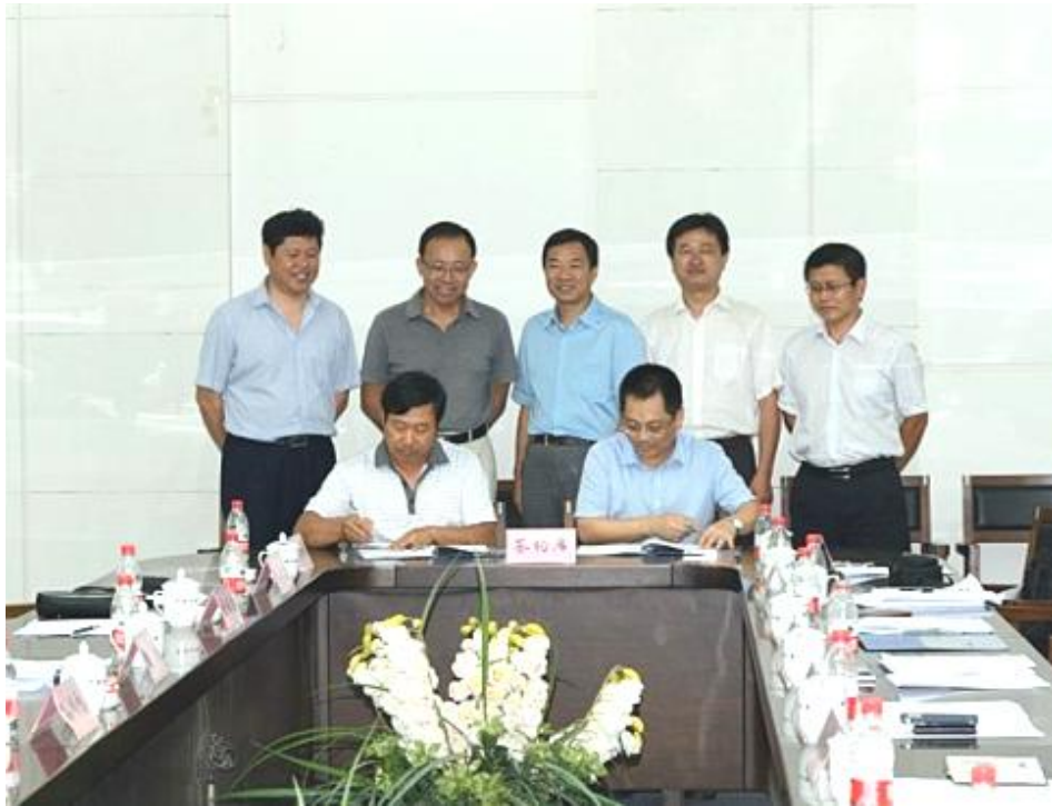
图3 联盟与宁城县政府签署合作协议

此次合作，为联盟成员发展提供了新的战略空间，标志着联盟迈出了“立足北京、面向全国”的第一步。未来联盟将扎实推进与宁城县的战略合作，全力拓展内蒙农业农村信息化市场，为进军全国打下坚实的基础。