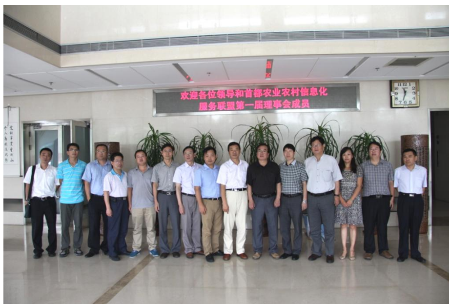
图 2 联盟第一届理事会成员单位代表合影

最后，新任理事长在总结讲话中明确表示联盟将秉承“服务为先”的理念，做好以下三个方面的工作：一是梳理农业农村相关信息化需求，帮助农民专业合作组织、涉农企业、家庭农场、行政村明确信息化发展方向和思路，并协助选择信息服务提供商，提供专业信息化服务；二是通过整合企业的服务资源，促进产、学、研、用结合和成果共享，形成相互支撑、协调并进、有效联合的产业发展环境；三是通过搭建沟通桥梁，衔接农业农村信息化需求与供给，形成全产业链良性合作、服务成果保障监督等长效机制，推动行业自律，保障服务品质，提高用户信誉度，营造互信互利的良好发展氛围。