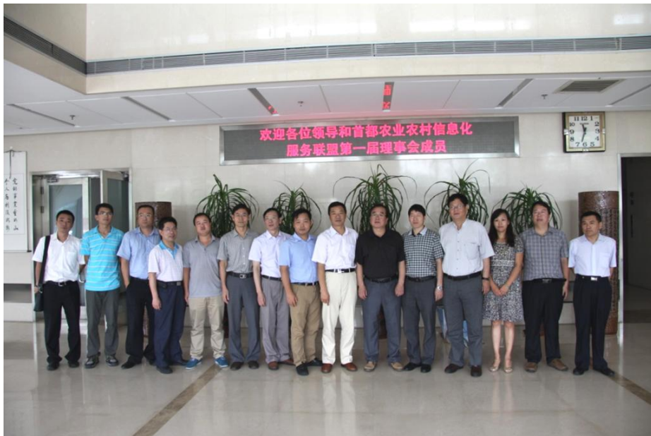
图 2 联盟第一届理事会成员单位代表合影

最后，新任理事长在总结讲话中明确表示联盟将秉承“服务为先”的理念，做好以下三个方面的工作：一是梳理农业农村相关信息化需求，帮助农民专业合作组织、涉农企业、家庭农场、行政村明确信息化发展方向和思路，并协助选择信息服务提供商，提供专业信息化服务；二是通过整合企业的服务资源，促进产、学、研、用结合和成果共享，形成相互支撑、协调并进、有效联合的产业发展环境；三是通过搭建沟通桥梁，衔接农业农村信息化需求与供给，形成全产业链良性合作、服务成果保障监督等长效机制，推动行业自律，保障服务品质，提高用户信誉度，营造互信互利的良好发展氛围。